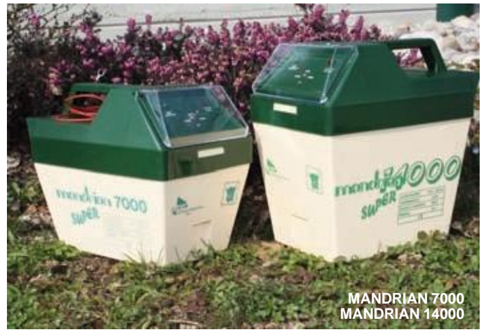
MANDRIAN 7000 MANDRIAN 14000