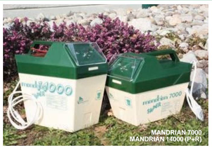
MANDRIAN 7000 MANDRIAN 14000 (P+R)